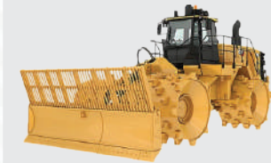
Landfill compactor Cat 836K