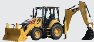
Backhoe Loader Cat 428F2