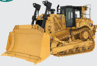
Bulldozer D8 Cat D8R