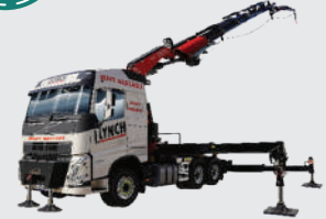
Tipper Crane truck Volvo FH16