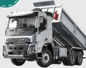
Volvo FH Dump truck