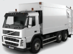
Compactor truck Volvo FM