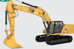
Hydraulic excavator Cat 336GC