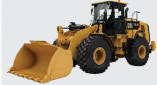
Wheel Loader Cat 950L