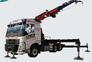
Damperli vinçli kamyon