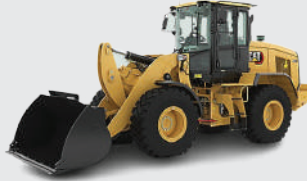
Küçük Lastikli Yükleyici.