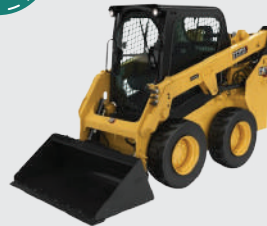
Nokta dönüşlü yükleyici.